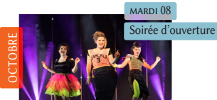
C'est Lalamour ! Les Divalala Chanson | Humour