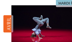
Fli Cie Art Move Concept Danse