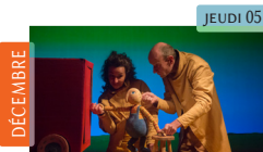
Petit détail Cie Rouges Les Anges Jeune public | Maternelle