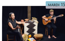
Galeano, sur le fil de ses mots Cie Cimi mondes Théâtre | Musique