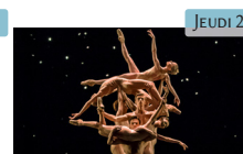
Ballet to Broadway : Wheeldon works Ballet Retransmission en direct