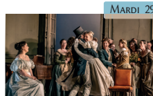
Les Noces de Figaro - Mozart Opéra Retransmission en différé