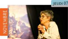
Le radeau de la méduse Anne Cangelosi Théâtre