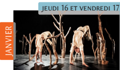
Pour Hêtre Cie léto Danse | Cirque