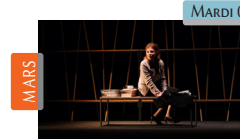
Gisèle Halimi, défendre ! Cie L'Ouvrage Théâtre