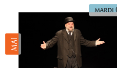
Jean Jaurès : une voix, une parole, une conscience Jean-Claude Drouot / Sea Art Théâtre