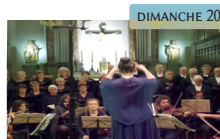
Chœur Tolosa Musique