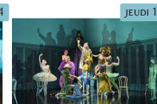
Les contes d'Hoffmann - Offenbach Opéra Retransmission en différé