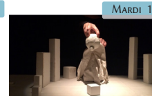
Rien Cie Atelier des Songes Jeune public | Primaire