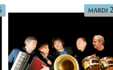
Orphéon Quintet Musique