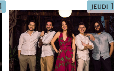
Projet Baudelaire 27 ème Printemps des poètes Chanson